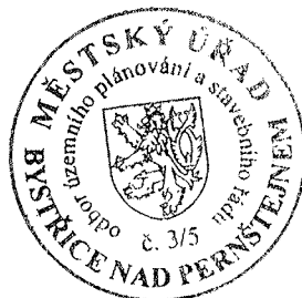
Ing. Tomáš Straka vedoucí odboru

Rozhodnutí má podle § 93 odst. 1 stavebního zákona platnost 2 roky. Podmínky rozhodnutí o umístění stavby platí po dobu trvání stavby či zařízení, nedošlo-li z povahy věci k jejich konzumaci.